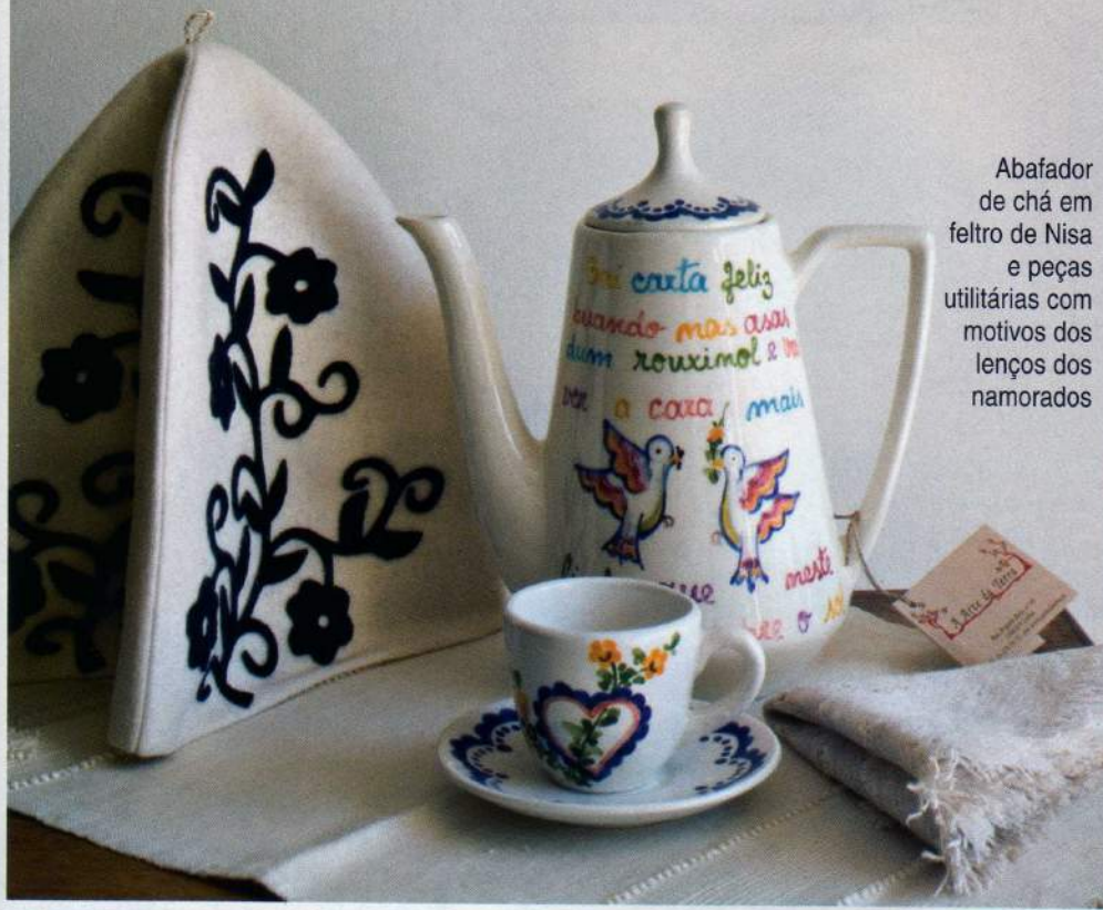
Abafador de chá em feltro de Nisa e peças utilitárias com motivos dos lenços dos namorados